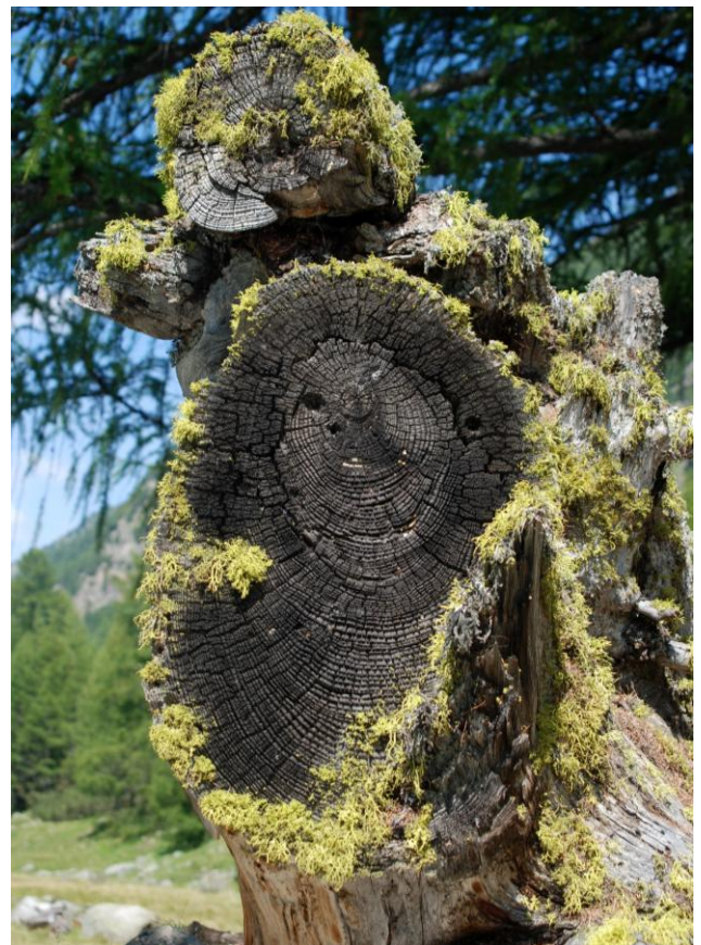
Auch der langsame Zerfall kann schöne Seiten haben! (Im Val Susauna)