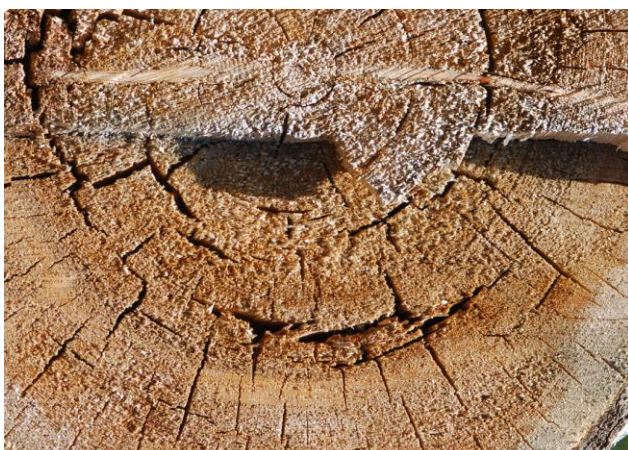
Beinahe ein lachendes Gesicht, in dem man die Jahrringe zählen kann. (S-chanf)