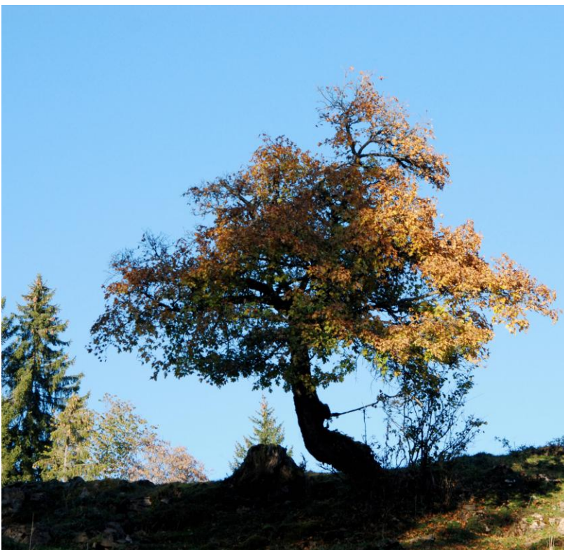
Diesen krumm gewachsenen Baum auf eine Weide habe ich in den vergangenen 12 Jahren alljährlich im Farbenkleid des Herbstes fotografiert. Er steht an einer Geländestufe, dem Wind ausgesetzt, und behauptet sich. Die Tanne hinter ihm ist erst in den letzten Jahren in Erscheinung getreten.