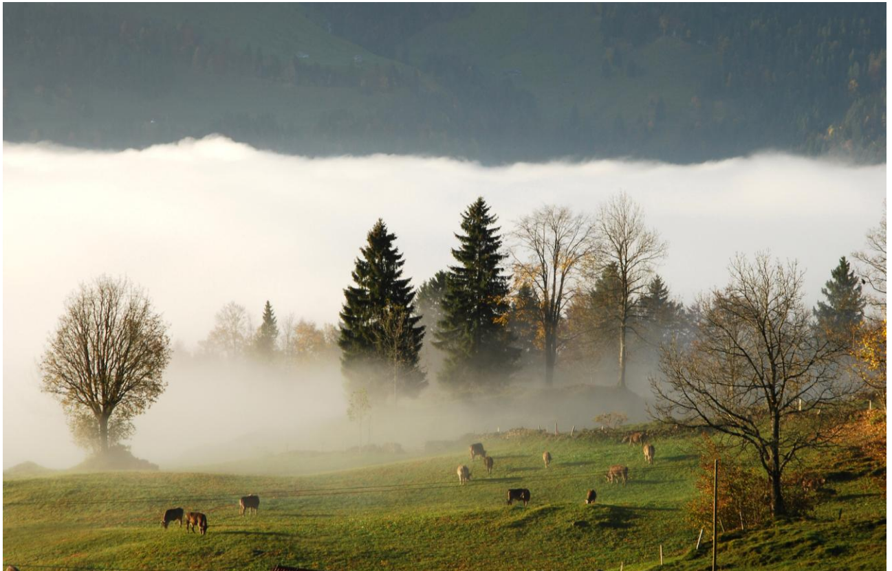
Morgenlicht über dem Nebelmeer (Im Muotatal)