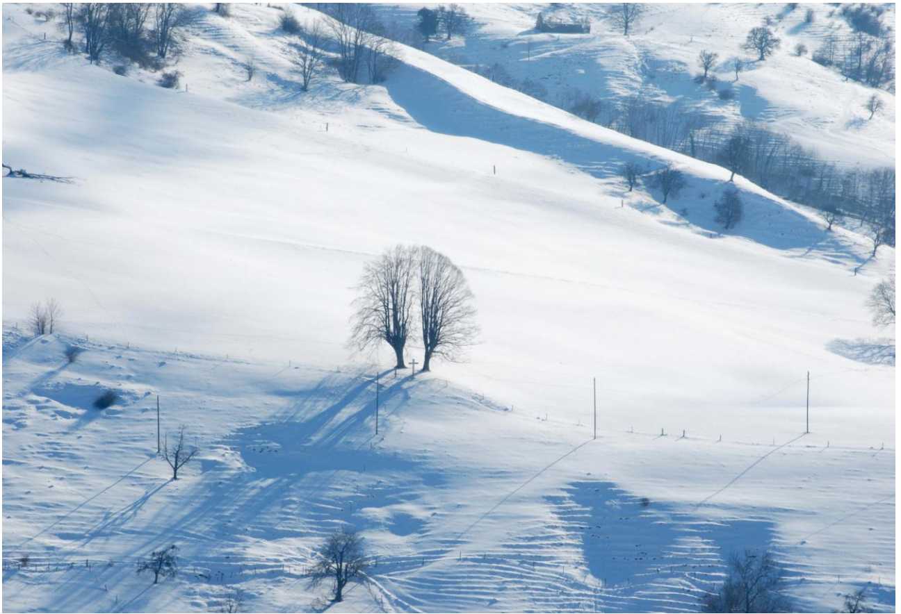
Der Zwillingenbaum bei Wisen zeigt im sich im Winter am deutlichsten. (Vom Martinsgrund aus gesehen)